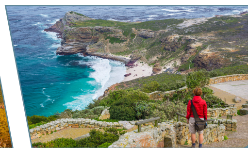
Capo di Buona Speranza

Partenza da Milano e Roma con voli Condor via Francoforte