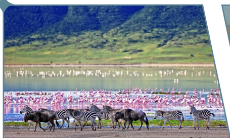
Il cratere di Ngorongoro