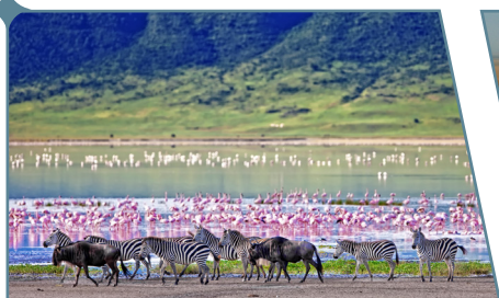
Il cratere di Ngorongoro