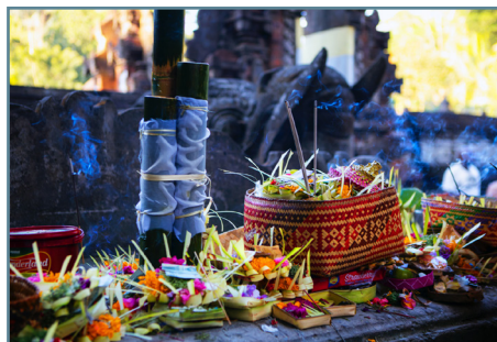
La cerimonia Hindu Dharma Bali