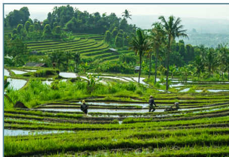
Le risaie a terrazze di Tegallalang